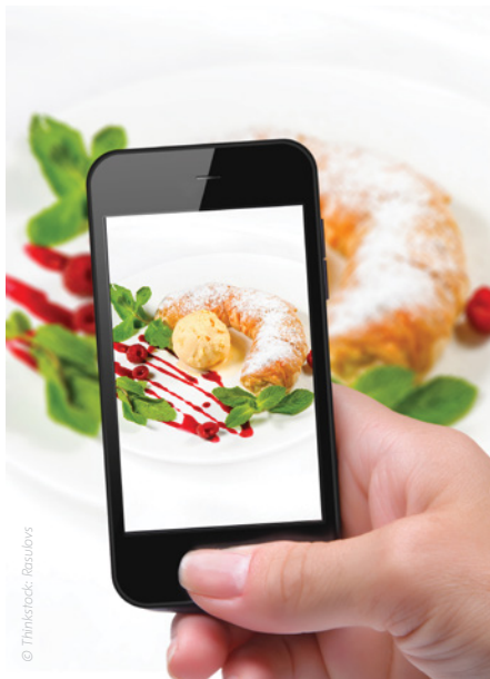
Auch Backwaren werden verstärkt durch die „digitale Brille“ betrachtet.

Das Unternehmen Apple steht für freies, offenes Denken und innovative Ideen. Da kommt man doch an einem offenen Netz fast nicht vor-