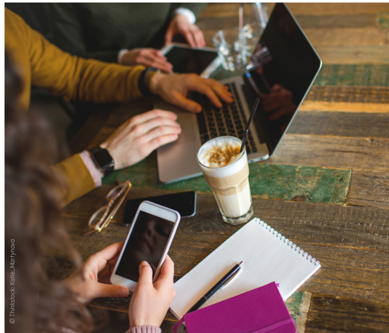
Immer vernetzt: Vor allem jüngere potenzielle Mitarbeiter bringen digitale Kompetenz mit, fordern sie aber auch vom Arbeitgeber ein.

Der Digitalisierungsgrad von Unternehmen bezieht sich nicht nur auf den Erfolg der Personalakquise. Auch das Bestandspersonal hat ein Auge da-